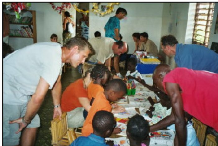
Passage d'un groupe ARVEL au jardin d'enfants de N'Dangane

L'an dernier les voyages avaient été annulés faute de postulants mais cette année, ce sont 45 « arvéliens » qui sont passées au CLEP . Un groupe de 10 au mois d'août (voyage du catalogue été) et deux groupes de comités d'entreprises en mars et en octobre.