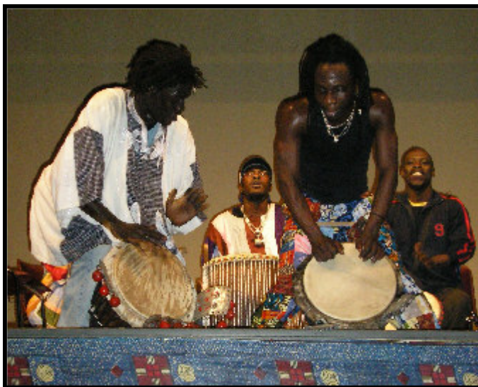
Les percussionnistes sénégalais en action le 14 octobre à Décines