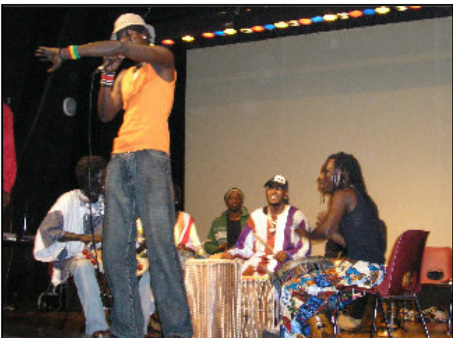
Chants et percussions sénégalaises ont rythmé la soirée

Le spectacle chanté des filles d' Echo Marengo tout d'abord, a ravi nos oreilles attentives, puis le repas quant à lui, a ravi nos papilles, à tel point que nous fûmes à court de vivres. Ensuite les contes de Cyril nous ont amenés jusqu'aux délicieuses et sucrées spécialités orientales. Enfin, la montée en pression de nos furieux percussionnistes mena la soirée à son apogée, la fièvre chaleureuse et rythmique opérait alors au milieu de la nuit... Mais c'était loin d'être terminé, et cette ambiance se prolongea jusqu'à plus de 4h du matin, au son d'une DJ-Feloché particulièrement insatiable.