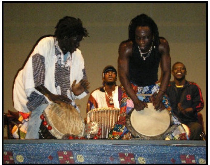
Les percussionnistes sénégalais en action le 14 octobre à Décines