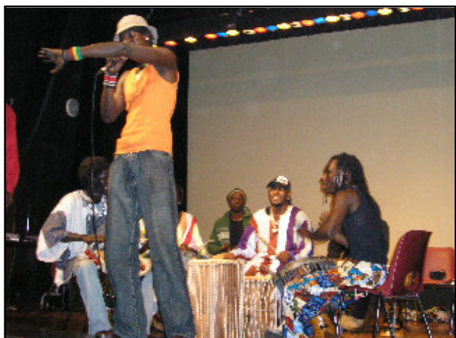
Chants et percussions sénégalaises ont rythmé la soirée