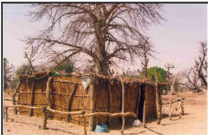
Au pied d'un baobab, le jardin d'enfants du village de Fissel Sérère dans une case en tiges de mil

En moyenne 35 à 40 enfants participent aux activités, encadrés par une animatrice (parfois un animateur) rétribuée avec les faibles cotisations que peuvent verser les parents. Les difficultés d'exercice liées aux conditions matérielles et le maigre revenu perçu rendent ce travail laborieux. Par exemple au village de BACK, la case en tiges de mil, adossée à l'école primaire, fonctionne depuis 2002, mais c'est déjà le 3 ème animateur !