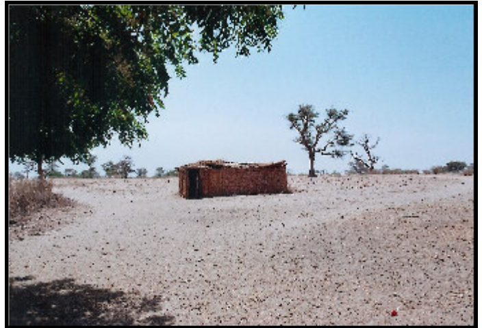
Case en tiges de mil qui accueille le jardin d'enfants de Pinakop