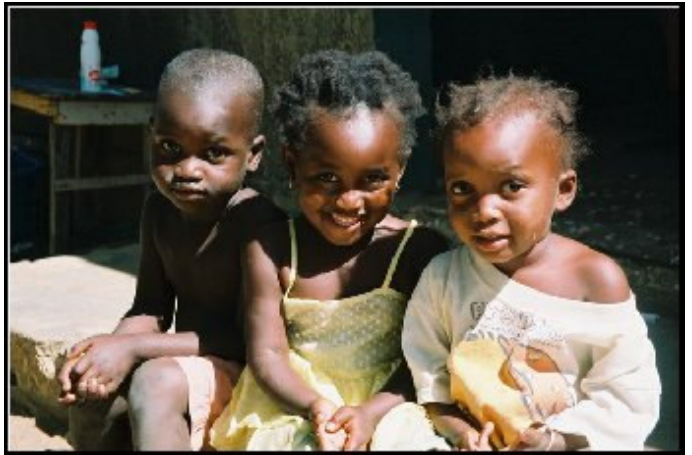
De nouveau des sourires à N'Dangane et au CLEP