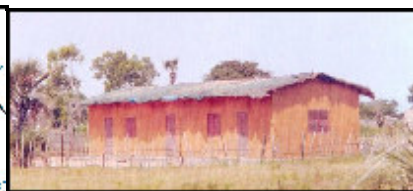
Le CLEP de N'Dangane (Centre de Loisirs et d'Education Populaire), une réalisation de Jángalekat

Jángalekat a trois ans... le point sur l'action et le fonctionnement de l'asso